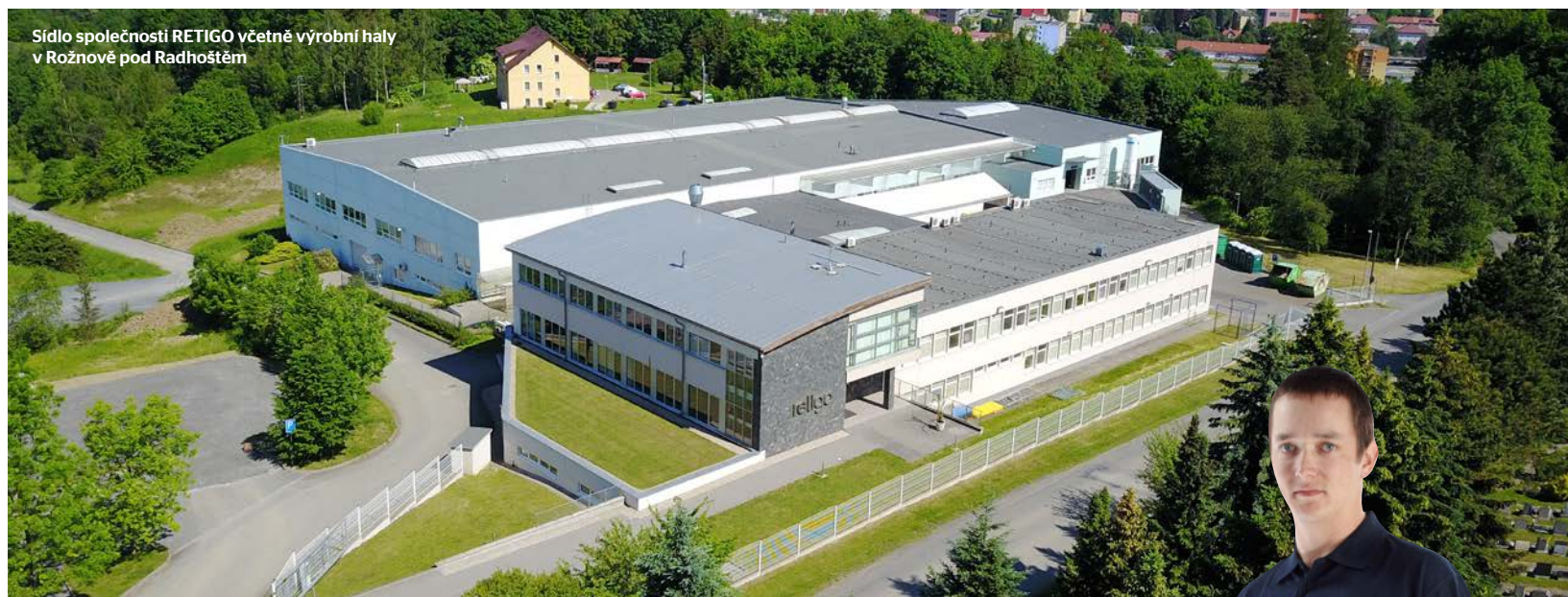
Sídlo společnosti RETIGO včetně výrobní haly v Rožnově pod Radhoštěm